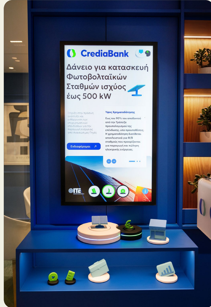
Καινοτόμο σύστημα εικονικής πραγματικότητας FinXR