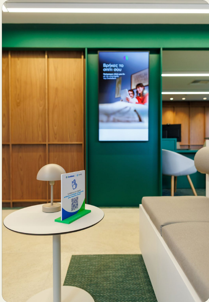
Η ψηφιακή εφαρμογή προσβασιμότητας, στο Κατάστημα Νέας Εμπειρίας CrediaBank στην Πανεπιστημίου