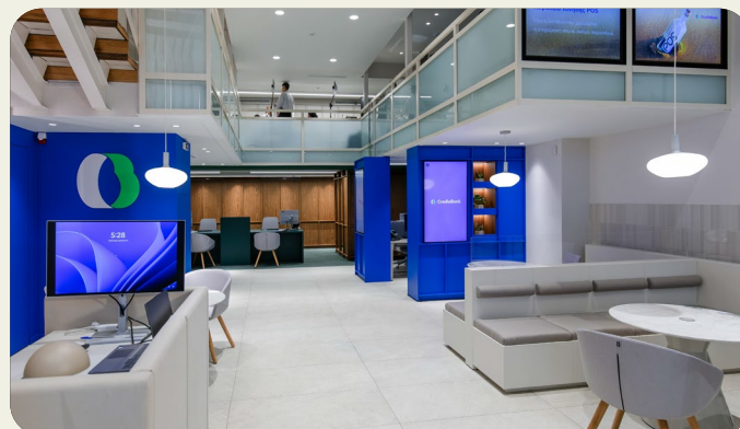
Το πρώτο Κατάστημα Νέας Εμπειρίας της CrediaBank