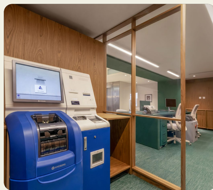
Ψηφιακή ταμειακή εξυπηρέτηση (Virtual Teller Station)